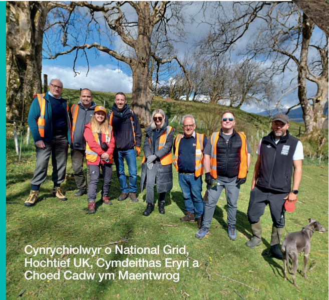
Cynrychiolwyr o National Grid, Hochtief UK, Cymdeithas Eryri a Choed Cadw ym Maentwrog