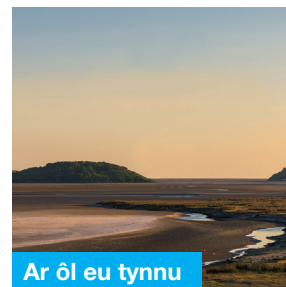
Ar ôl eu tynnu