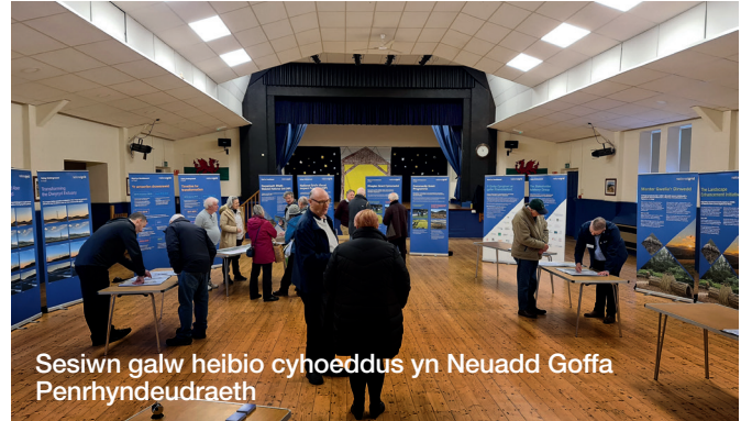
Sesiwn galw heibio cyhoeddus yn Neuadd Goffa Penrhyndeudraeth

Roedd cryn ddiddordeb hefyd mewn cyfleoedd gwaith posibl i'r bobl leol ac yn y gadwyn